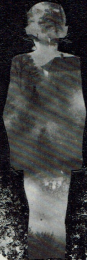
Fig. 27. — Niño con leucemia inmadura. No de mejo- ría de todos los tipos bajo la acción del arsénico y del tratamiento roentgenológico.