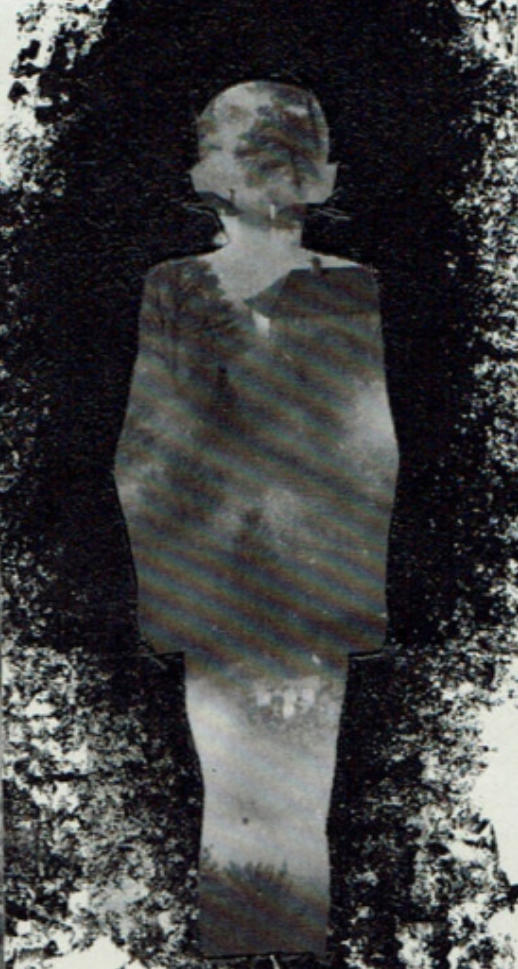
Fig. 27. — Niño con leucemia inmadura. No de mejo- ría de todos los elementos bajo la acción del arsénico y del tratamiento roentgenológico.